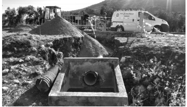
Arreglo de la Fuente del Aguardiente en la antigua carretera de Cabra. Se recupera el agua perdida por problemas de calcificación.