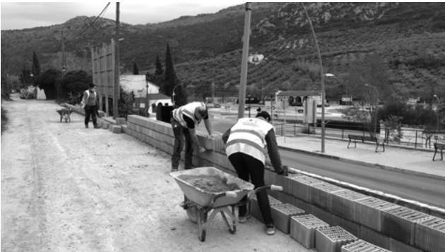
Gracias a un remanente del PER se está interviniendo en el muro frente al hotel, con la intención de continuar arreglando las entradas de la localidad.