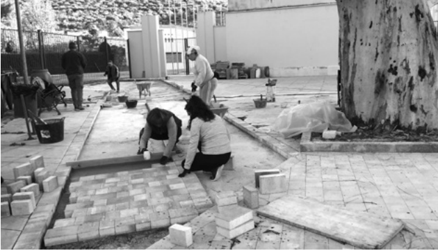
Arreglo del acceso al interior de la Iglesia Vieja. La nueva entrada con tacos hace posible la entrada de vehículos.