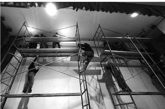
Instalación de una gran pantalla para proyecciones en el escenario del salón de actos de la Casa de la Cultura "Juan Valera".