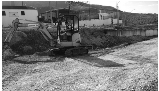
Se acondiciona un acceso alternativo para que la espera en la entrada de aceitunas a la Cooperativa no ocasione peligros en la carretera.