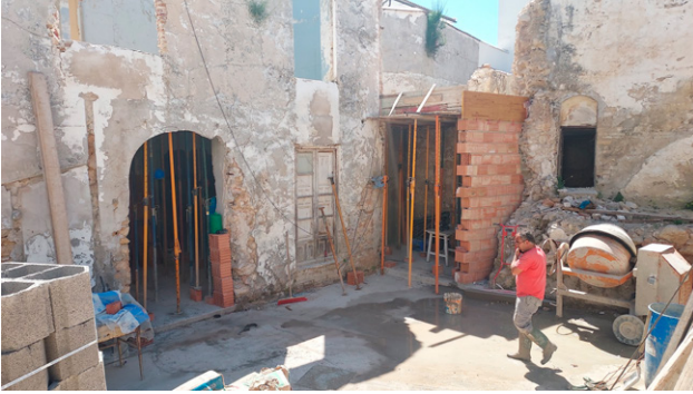
Continúan las obras en la casa de Manolo Vergara en la calle Obispo Cubero.