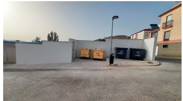
Acerado accesible y ubicación de contenedores en Historiador Padre Cantero.