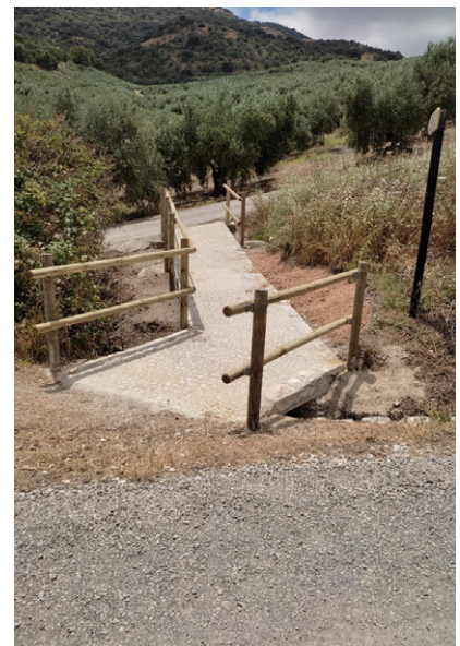
Actuación de los trabajadores del PFEA de la Vía Verde creando una conexión que permite acceder desde la Vía Verde hasta el Camino de la Plata.

Las alumnas deben estar inscritas en el SAE como demandantes de empleo, para poder acceder a estos cursos que continuarán en el mes de septiembre en Doña Mencía.