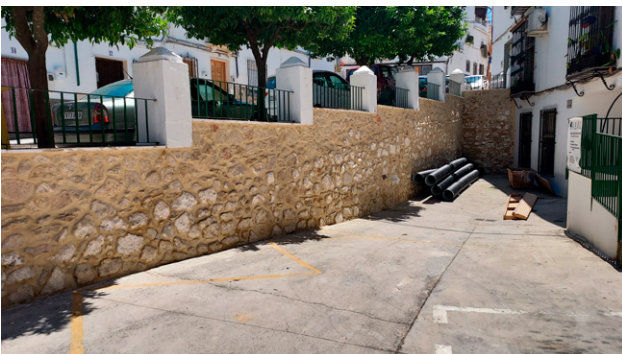
Intervención en el Convento, con arreglos del seneamiento, instalaciones de agua, pavimento y muros.