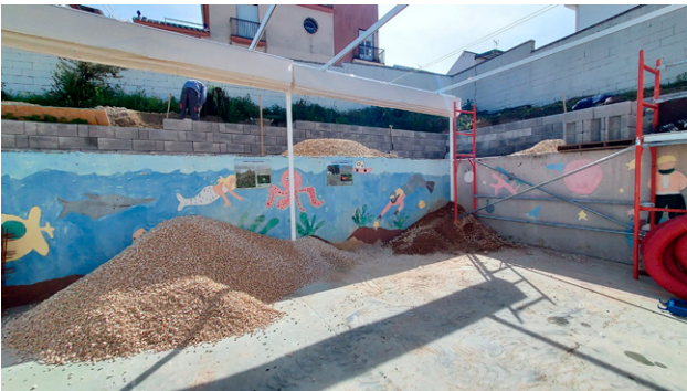
Actuación en el patio del colegio.