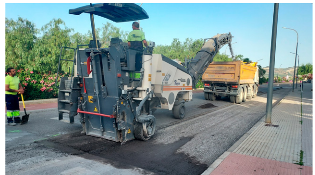
Asfaltado en la Avenida de Chartrettes.