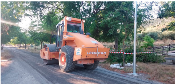
Actuación mediante riego asfáltico en el trazado de la Vía Verde del Aceite.