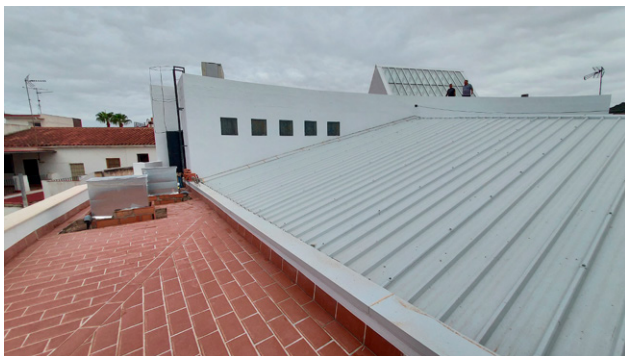
Comienzan las obras de climatización de la Casa de la Cultura.