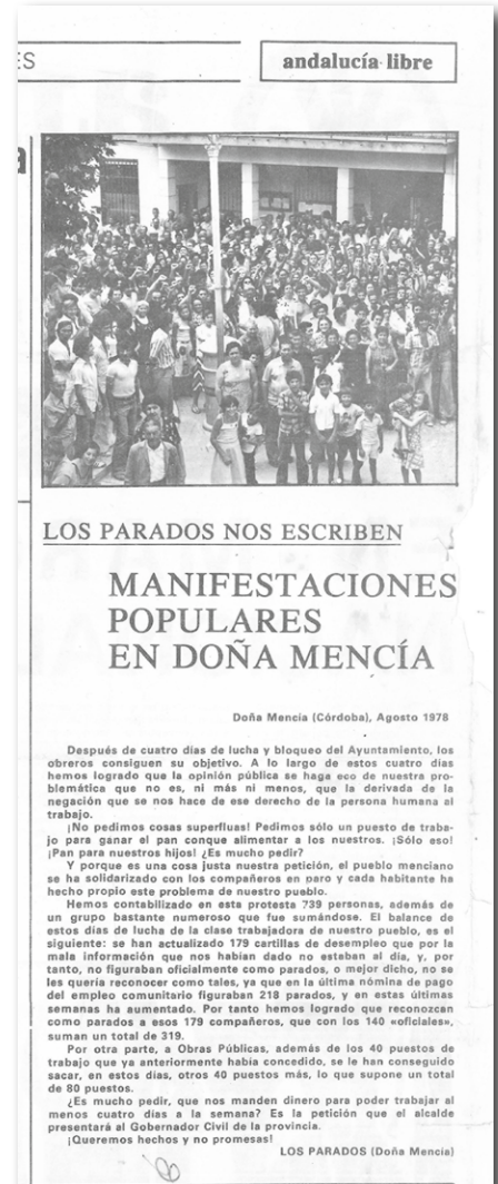
Recorte de prensa del periódico Andalucía Libre en agosto de 1978

social de nuestro pueblo y de sus gentes.